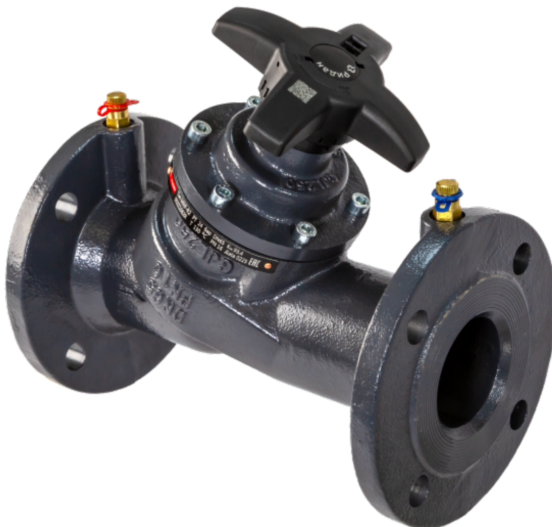
Рис. 1 Общий вид клапана типа MNF, модификация MNF-R2

Клапаны балансировочные типа MNF, модификация MNF-R2 (далее – клапан MNF-R2) используются для монтажной наладки трубопроводных систем тепло - и холодоснабжения зданий и сооружений с целью обеспечения в них расчетного потокораспределения.